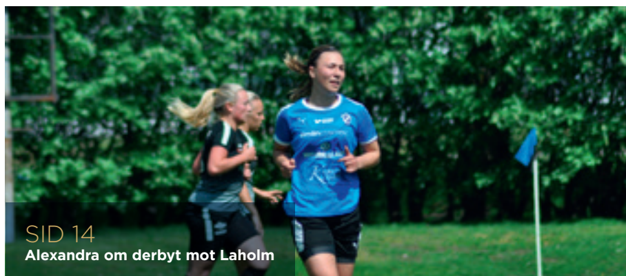
SID 14 Alexandra om derbyt mot Laholm