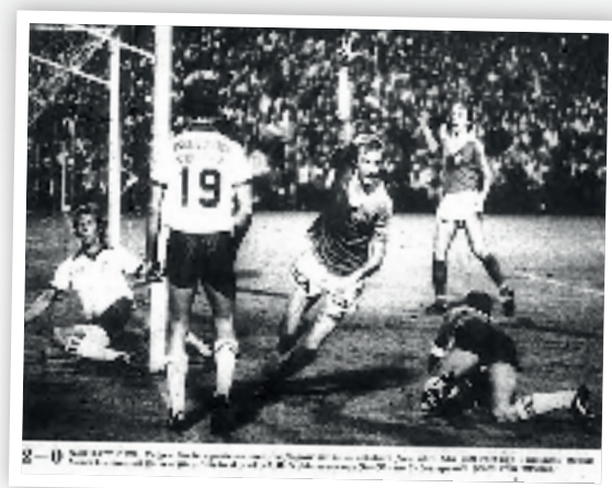
Faksimil från Hallandsposten 1979-08-24

Om det var jämnt i den matchen, så var det inte likadant i serien. HBK blev svenska mästare medan IS Halmia efter en säsong fick lämna högsta serien.