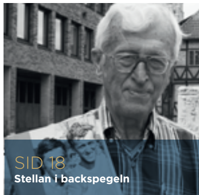
SID 18 Stellan i backspegeln